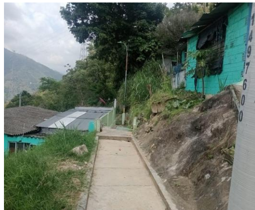
Fotografía 4. Visita técnica barrio La Independencia 2 del municipio de Bucaramanga.