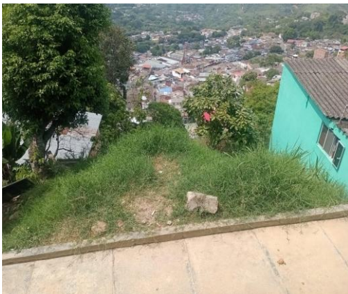
Fotografía 3. Visita técnica barrio La Independencia 2 del municipio de Bucaramanga.