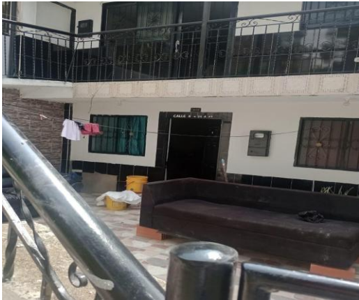
Fotografía 1. Visita técnica calle 5 # 25 A-43 barrio La Independencia 2 del municipio de Bucaramanga.