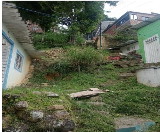
Fotografía 2. Visita técnica barrio La Independencia 2 del municipio de Bucaramanga.