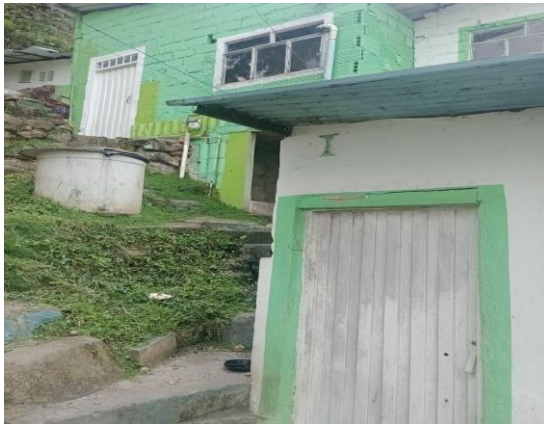
Fotografía 3. Visita técnica calle 5 # 25 A barrio La Independencia 2 del municipio de Bucaramanga.