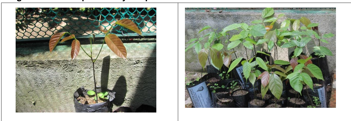
Ilustración 8: Plántulas de Clathrotropis brunnea