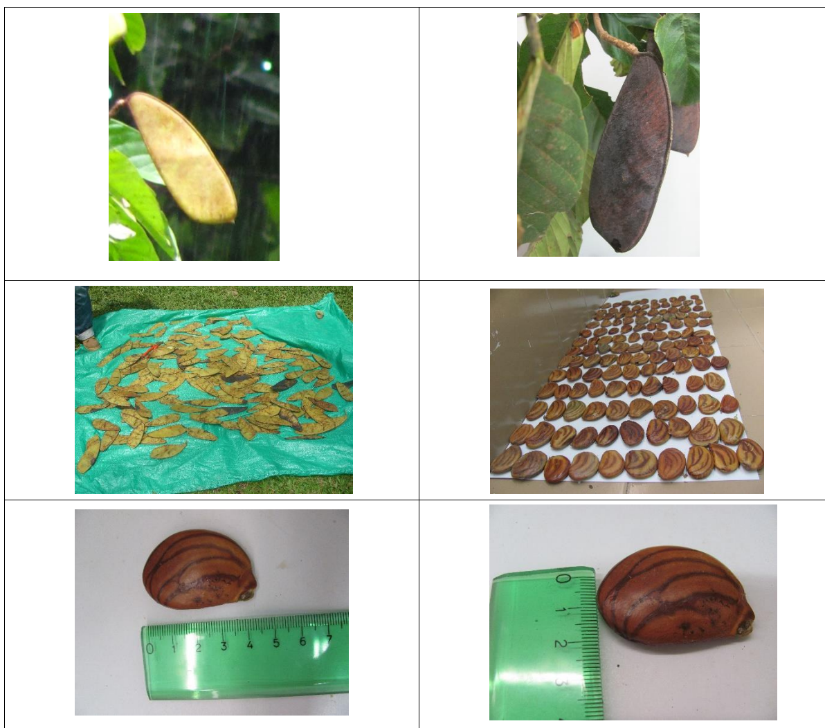
Ilustración 4: Frutos y semillas de Clathrotropis brunnea

Fruto seco, tipo legumbre de capsula dehiscente, de 15 a 20 cm, que al madurar libera de 1 a 3 semillas algo ovaladas de 2 x 4 cm, de color café, aladas. El mejor momento para la recolección es justo antes de que las cápsulas se abran y dispersen las semillas. Por tanto se recomienda recolectarlas cápsulas del árbol cuando están casi maduras (color amarillo a marrón).