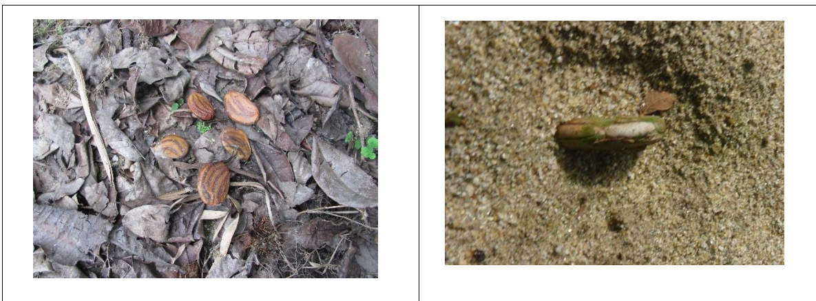
Ilustración 5: Siembra de semillas de Clathrotropis brunnea en germinadores

50 semillas fueron dispuestas en la superficie de la arena, y 50 fueron dispuestas sobre el suelo y cubiertas con hojarasca.