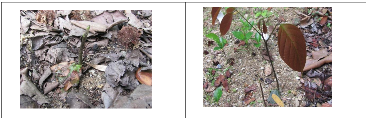
Ilustración 6: Germinación de las semillas de Clathrotropis brunnea