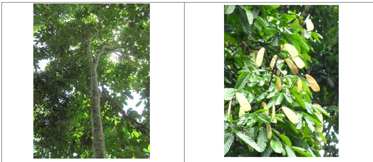
Ilustración 3 A. Estado vegetativo Clathrotropis brunnea

Se presenta dispersión de semillas por gravedad, y se pueden encontrar frutos en el árbol hasta el mes de noviembre cuando ya se encuentra plántulas germinadas hasta unos 15 metros de distancia del árbol padre.