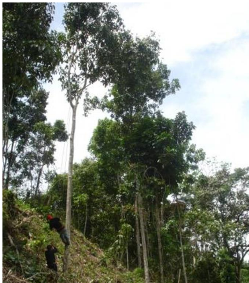
Ilustración 1: Árbol de Sapan, ubicado en el municipio del Playón