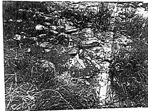
Fotografía 3 - 4. Vertimiento de agua residual doméstica sobre la lámina de agua de la quebrada La Baja, hechos evidenciados el 20 de agosto de 2019.